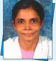
યોગીની શાહ ટ્રસ્ટી, સાકવા